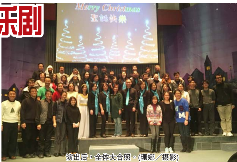
演出后,全体大合照。

(记者黄相慈/休士顿报导) 随著圣诞节脚步接近,除了街上能感受节庆氛围,教会也展开各式各样的圣诞布道会,弟兄姊妹相聚在一起,格外温馨。晓士顿中国教会于上周五、六两天晚间,连续演出两场「意料之外」(Unexpected)圣诞音乐剧,叙述两位男女主角如何走过生命中意料之外的人生故事;精彩演出吸引众多教友观赏,温暖人心。