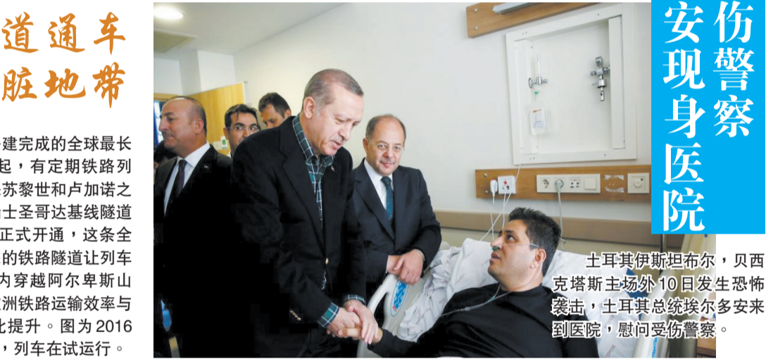
土耳其伊斯坦布尔，贝西克斯体育场外10日发生恐怖袭击，土耳其总统埃尔多安到医院慰问受伤警察。