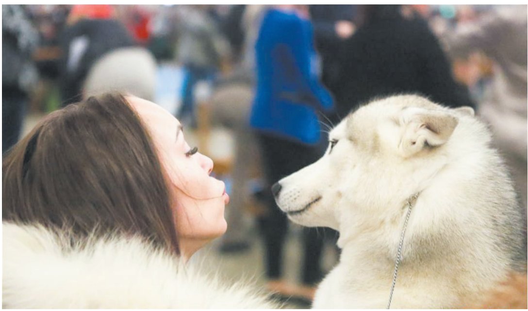
“赫尔辛基优胜者”宠物狗比赛在芬兰赫尔辛基举行，壹名女士带著爱犬在赛场边休息。壹年壹度的“赫尔辛基优胜者”宠物狗比赛是芬兰规模最大的宠物狗比赛和展示活动。今年的比赛于12月10至11日在赫尔辛基展览中心举行，共有数百个品种约1.7万只宠物狗参加了比赛。