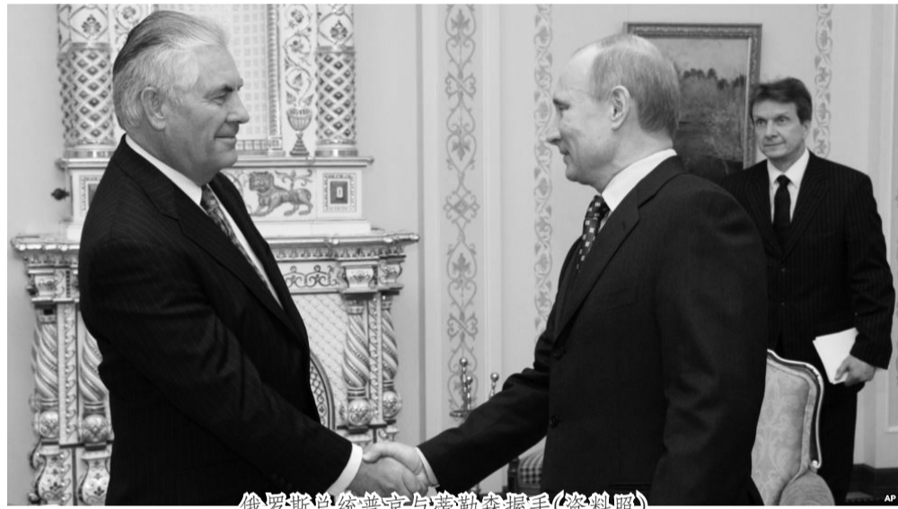
俄罗斯总统普京与蒂勒森握手(资料照)

【VOA】据美国媒体报道,美国当选总统川普星期二将提名埃克森美孚公司首席执行官雷克斯·蒂勒森为国务卿。