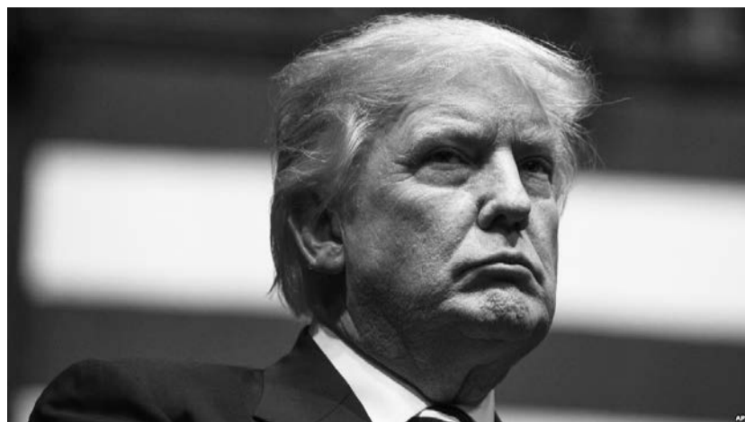
美国候任总统川普2016年12月9日在密西根一次集会上讲话。

欧内斯特还说,“支持候任总统川普的国会共和党界人士都知道这件事。他们如何在政治策略和他们的爱国主义之间进行妥协,是他们必须要做出解释的。”